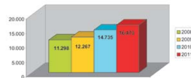
Exames de preventivos

O exame de Papanicolau ou Preventivo verifica alterações nas células do colo do útero, que é a parte mais baixa do útero que o liga à vagina. O exame serve para verificar alterações nas células cervicais. As mulheres, principalmente as sexualmente ativas, devem se submeter ao exame pelo menos uma vez por ano.