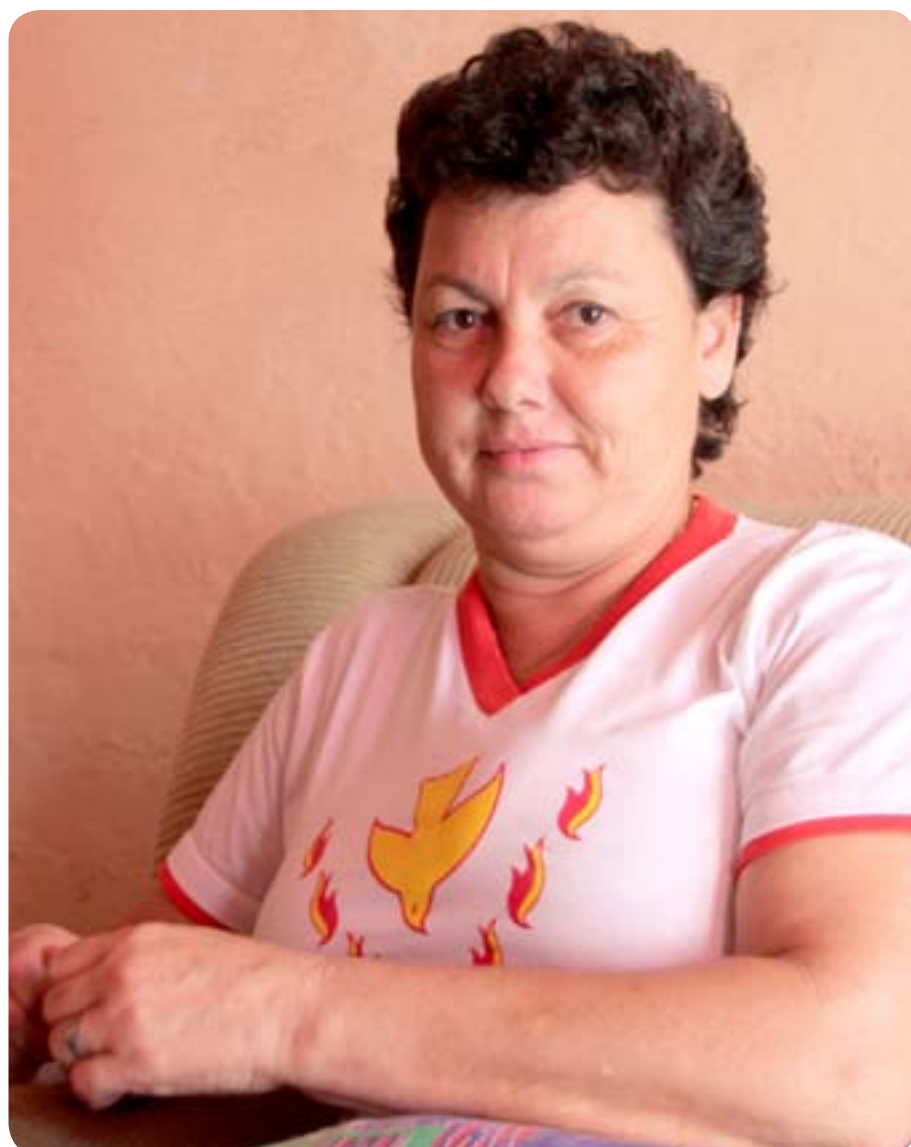
Paciente recebe medicamentos e transporte para tratamento

capital para a realização da quimioterapia que é custeado pela Prefeitura. Além disso, a paciente toma medicamentos que chegam a R$12 mil mensais. “Não pago nada por isso. Não teria condições”, desabafa.