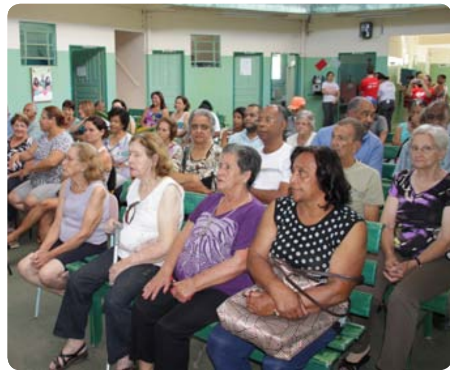
Comunidade elogiou o investimento da Prefeitura